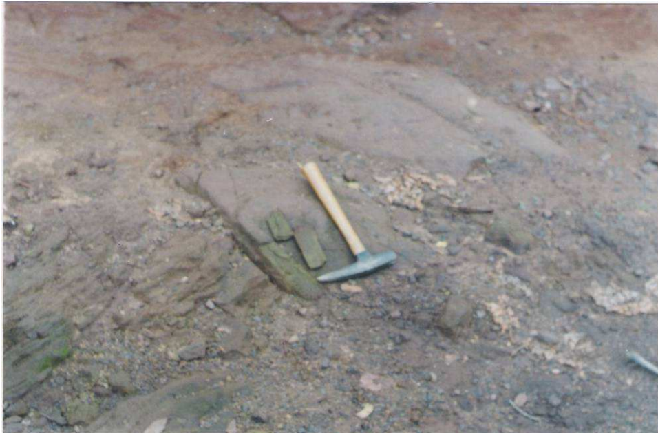
Figura 2 - Detalhe em afloramento da Formação Furnas numa nova ocorrência detectada no leito da rodovia estadual MT-373, em terrenos da Fazenda Patagônia no município de São Pedro da Cipa, onde esta unidade litoestratigráfica apresenta-se constituída, por conglomerados na base e arenitos no topo, contendo por vezes intercalações de níveis argilosos e siltíticos.

Formação Aquidauana – Deve-se também a Derby (1895), a primeira referência acerca da desta unidade litoestratigráfica, e regionalmente predominam clastos grossos (diamictitos, arenitos grossos a conglomeráticos) e finos (siltitos, argilitos, folhelhos e arenitos finos). Algumas das formas de relevo tabuliforme que ocorrem na bacia do rio das Pombas, estão atribuídas à Formação Aquidauana.