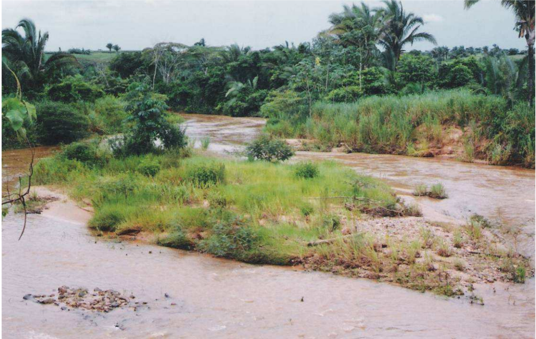
Figura 8 - Aspectos dos organossolos típicos na faixa marginal direita e no leito do rio das Pombas, onde a sedimentação aluvionar é recente. São bem drenados e correspondem as aluviões elevadas. (Foto – Lucelma Aparecida Nascimento, 2004).

Vegetação – Na cobertura vegetal predomina o Cerrado (Savana) com presença de Campo Cerrado (Savana Arbórea Aberta), Campo Sujo (Savana Parque), Campo Limpo (Savana Gramino-Lenhosa), Matas, Cerradão (Savana Arbórea Densa) e Áreas Desmatadas (Pastagens e Cultivos) (Amaral et al. 1982 e Bittencourt Rosa et al. 2002).