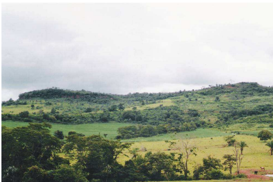
Figura 3 - Exposição em escarpas da Formação Ponta Grossa, localmente constituída por sedimentos finos a muito finos, com arenitos na base, folhelhos silticos e argilosos, e siltitos no topo, bem observados em terrenos da Fazenda Grotão, município de São Pedro da Cipa. (Foto – Deocleciano Bittencourt Rosa, 2004).

Grupo Parecis – A denominação de Grupo Parecis foi proposta por Barros et al. (1982), em face da extensão territorial geográfico-geológica desta unidade e de suas características. Corresponde a unidade que delimita as Bacias do Alto Rio Paraguai e Amazônica. Recentemente Weska (2006), publicou uma síntese de seus estudos acerca do Cretáceo Superior no Estado de Mato Grosso, onde esse estudioso fez uma revisão da unidade litoestratigráfica Grupo Bauru em comparação com o Grupo Parecis, e por ser esta última unidade a mais antiga, na escala geológica do estado, e por possuírem as mesmas características litológicas, Weska (2006) apresenta uma nova coluna estratigráfica, com a presença somente do Grupo Parecis, com a seguinte constituição litológica, assim distribuída da base para o topo: Formações Paredão Grande, Salto das Nuvens, Cachoeira do Bom Jardim e Utariiti.