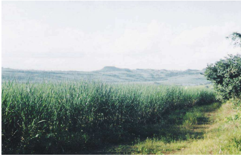
Figura 7 - Plantação de cana de açúcar em área de predominância de latossolos vermelho escuro eutróficos na localidade de Gleba São Paulo, município de Dom Aquino..

Neossolos Regolíticos e Litólicos – Estes solos se desenvolvem sobre as rochas profundamente intemperizadas, encontradas na área em foco.