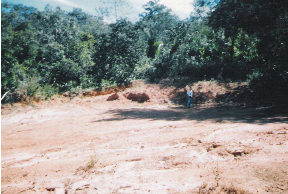
Figura 9 - Detalhe do andar arbóreo do cerrado localmente, com árvores de grande porte (2 a 25 metros de altura), bem espaçadas e com caules recobertos por uma espessa casca, bastantes tortuosos (inclusive os galhos), com folhas grandes e pilosas. (Foto – Deocleciano Bittencourt Rosa, 2004)