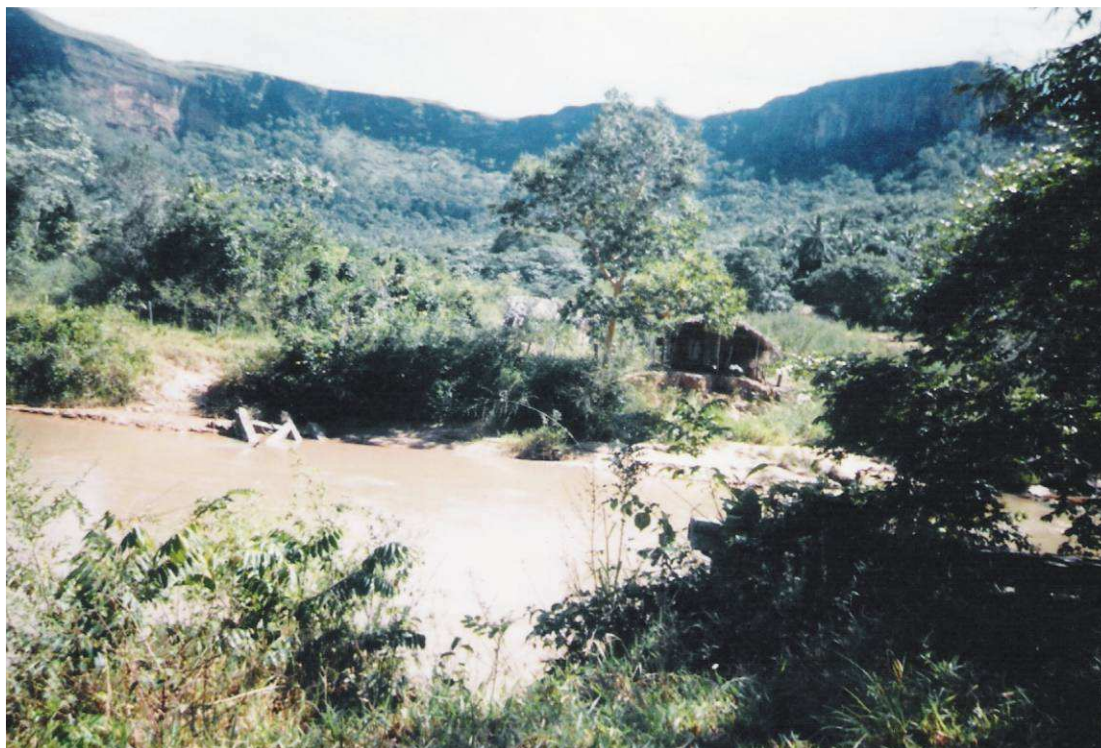
Figura 4 - Panorâmica do Morro das Pombas na localidade homônima no município de Dom Aquino, constituído litologicamente por rochas areníticas e silcretos da Formação Utiariti. (Foto – Deocleciano Bittencourt Rosa, 2004).

predominância, às vezes, em contato por falhamento com as Formações Paredão Grande e Botucatu, e na bacia em questão é parte integrante da constituição do Morro das Pombas, na localidade homônima (Figura 4).