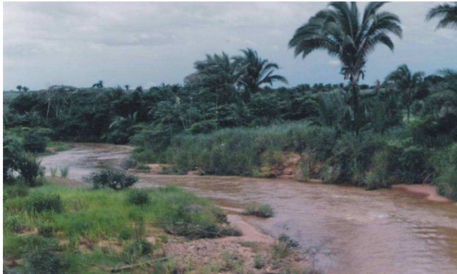
Figura 5 - Aluviões do rio das Pombas na divisa dos municípios de Dom Aquino e São Pedro da Cipa, constituídas, muitas vezes, de areias, argilas, carbonatos, seixos de quartzo, opala, sesquióxidos de ferro, concreções ferruginosas, entre outros.

Lourenço, e o segundo, a toda rede de drenagem do rio das Pombas. As altitudes oscilam entre 200 a 500 metros (Figura 6).