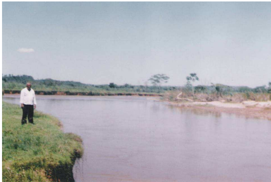
Figura 6 - Compartimento mais baixo que corresponde geomorfologicamente a área de drenagem do rio São Lourenço no município de Juscimeira..